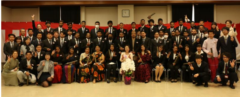
【3月】卒業式・春季休暇